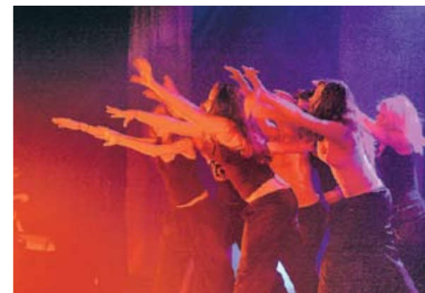
... OCH DANS