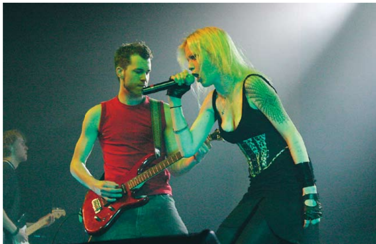
UKM ÄR en festival där vi visar upp vår egna kultur!