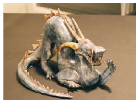
... OCH KONST...