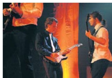
UKM ÄR MUSIK...