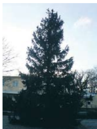
STOR OCH STÅTLIG. Det verkar alltid som om just årets julgran är den ståtligaste av dem alla.

Har du viljan att synas och göra din röst hörd? Tror du att du är vi söker skicka ett mail till anders@hallonsoda.se med en kort beskrivning av dig själv och varför du skulle passa som Dusch-reporter.