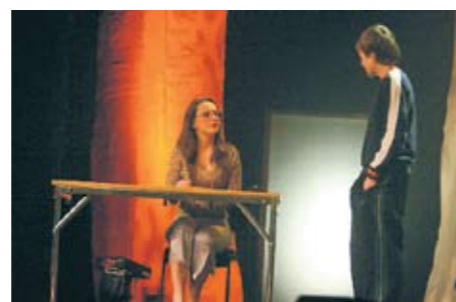
... OCH TEATER...