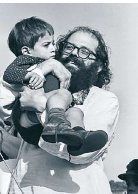
ALLEN GINSBERG kom att bli en av de synliga ansiktena bakom hippierörelsen under 60-talet.