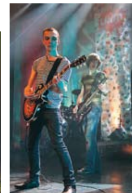
THE CHEAP SURPRISES spelade...