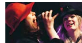
SOLU TRIP.