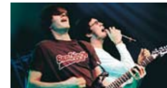
SAIL SET SPINE.